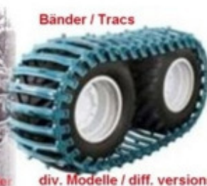
Bänder / Tracs