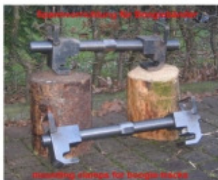
Spannvorrichtung für Bogienbänder